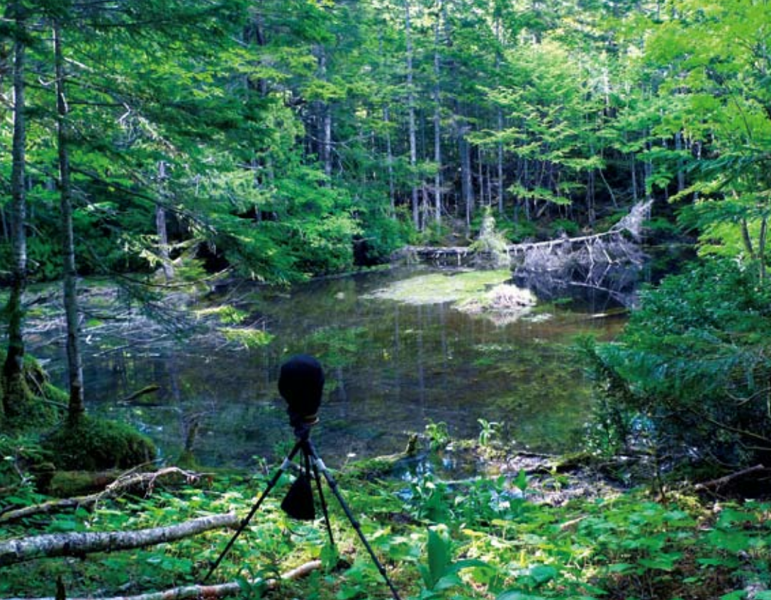
クイズ No2 の録音風景