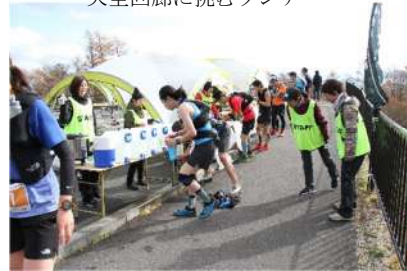
園地内に設置されたエイドステーション

40 km コースは霧降高原キスゲ平園地を経て、標高 1689 m の丸山山頂を越えるコースとなり、スタート・ゴール地点との標高差約 1000 m の厳しい山岳レースとなりました。