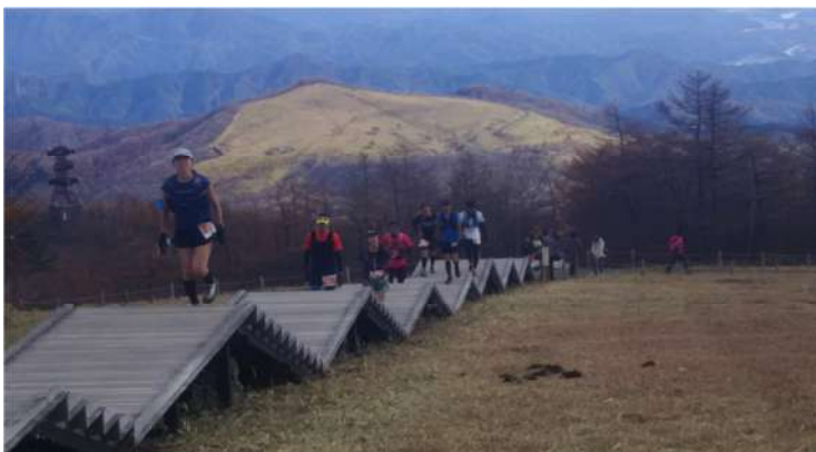
1445 段の天空回廊は鍛えたランナーでも“キツイ”

山を走る山岳スポーツのマウンテンランニングは、近年愛好者が増加してきており、この霧降高原にも普段からトレランニングに訪れるお客様が見受けられるようになりました。このような大会を通じて霧降高原の魅力がさらに高まり、公園利用の幅が広がるとともに、自然環境・保護意識の高揚が図られることが期待されます。