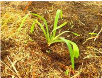
補植したキスゲの苗

ニッコウキスゲ補植 今年も恒例となっているニッコウキスゲの補植イベントを春と秋に実施し、合計1500株の苗を植えました。このイベントは昭和50年頃から続いているもので、シカの食害により減少したニッコウキスゲを増やそうと毎年開催しています。今年は園内に入っすぐの場所に補植しました。来年、補植したキスゲが咲き、来園者を迎えてくれることを願っています。