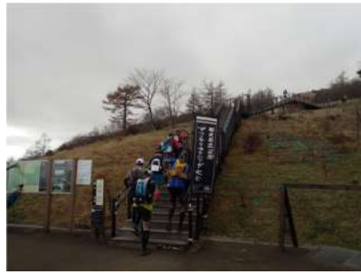
天空回廊に挑むランナー

十一月十(日) 第四回日光国立公園マウンテンランニング大会が開催されました。世界遺産日光の社寺をスタート・ゴール地点に、距離 40 km と 17 km の 2 コースを約 1000 名のランナーが、秋深まった日光の山々を駆け抜けていきました。