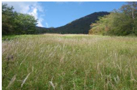
カリヤスモドキ群落

秋の陽射しを浴びて美しく銀色に輝く穂先の波は、秋のキスゲ平を飾る最後の彩りです。