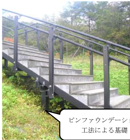
ピンファウンデーション工法による基礎

不思議な形の基礎 天空回廊の階段には不思議な形の基礎が使われています。この基礎は「ピンファウンデーション工法」と呼ばれているものです。基礎の運搬の際に、重機を使用せず、工事も人の力だけで行えるため、自然環境を壊さず、重機が入れないような急斜面でも工事を行うことができます