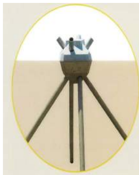
発想は木の根っこ

天空回廊の建設に当たっては、ニッコウキスゲが咲く貴重な自然環境を守るため、環境に優しい「ピンファウンデーション工法」が採用されました。 発想は木の根っこ 木は地面の下に広がるように根を張って強風に耐えています。ここから発想を得て、木の根のように地面に4本のパイプを斜めに打ち込むことで、木の根と同じ強さを発揮させています。「ピンファウンデーション工法」は木の根っこを真似て開発された基礎です。 階段の基礎に注目してみてください。