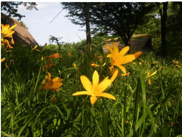
うつのみや遺跡の広場のニッコウキスゲ群落

とすと左の図のようになります。茨城県北茨木市にも分布していますが場所が判然としないのでここでは表示していません。青丸で示した場所が標高千メートルを超える群落、赤丸は100メートル前後の群落です。このように、ニッコウキスゲ群落は、高山型と低地型の2タイプに分けられますが、花の大きさや遺伝的な型にはあまり違いがないようです。しかし立地している環境は、高山型群落は広々とした草原や湿原であるのに対し、低地型群落は雑木林の下など高山型とは