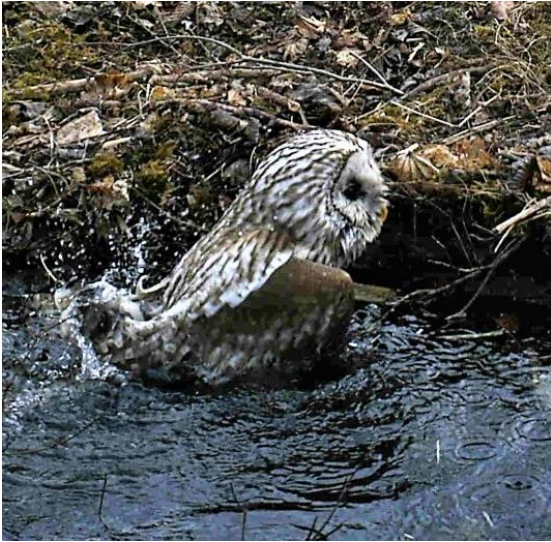
撮影日時 4/25 AM7:11~25 の約 15 分間カメラに記録される